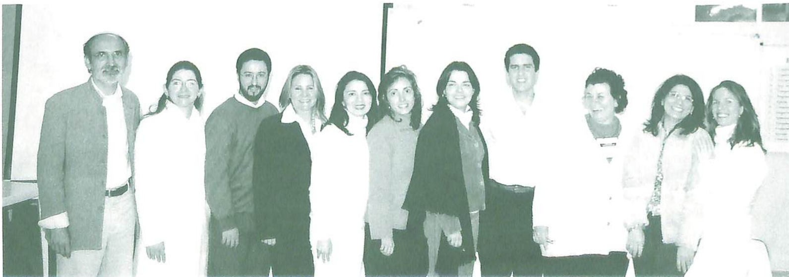
Integrantes do Virtual Ethos já em ritmo de evento