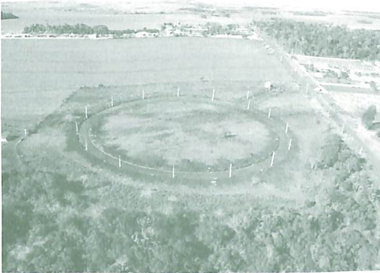
Foto aérea do terreno

Aprovado em novembro de 2003 pelo Instituto Ambiental do Paraná (IAP), o projeto do condomínio já está liberado pela administração pública de Foz do Iguaçu.